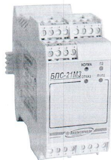
в) БПС-21М3-24x16-ibIIВ БПС-21М3-24x16-ibIIС БПС-21М3-24x24-iaIIС