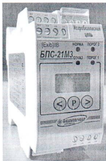
б) БПС-21М3-220x16-ibIIВ БПС-21М3-220x16-ibIIС БПС-21М3-220x24-iaIIС БПС-21М3-220x24