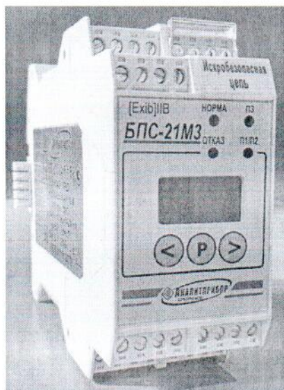
а) БПС-21М3-24x16-ibIIВ-Р БПС-21М3-24x16-ibIIС-Р БПС-21М3-24x24-iaIIС-Р БПС-21М3-24x24-Р

Схема пломбировки блоков от несанкционированного доступа приведена на рисунке 2.