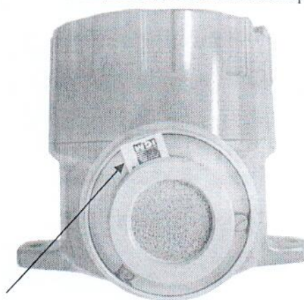
Место нанесения пломбы