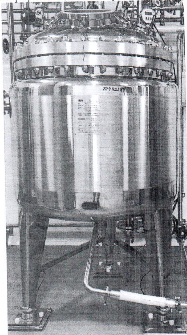
Рисунок 1.1 – Внешний вид весов бункерных ВБ-500 №319

Фотографии общего вида средства измерений