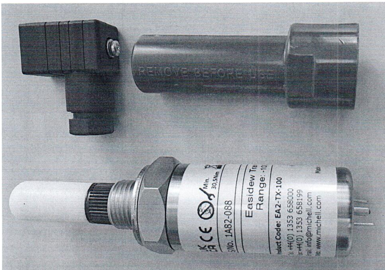
Рисунок 1.1 – Общий вид преобразователя температуры точки росы/иней Easidew Transmitter № 1A82-088