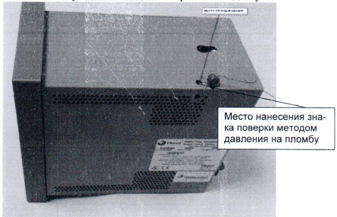
Рисунок 3.1 – Место пломбировки на боковой поверхности