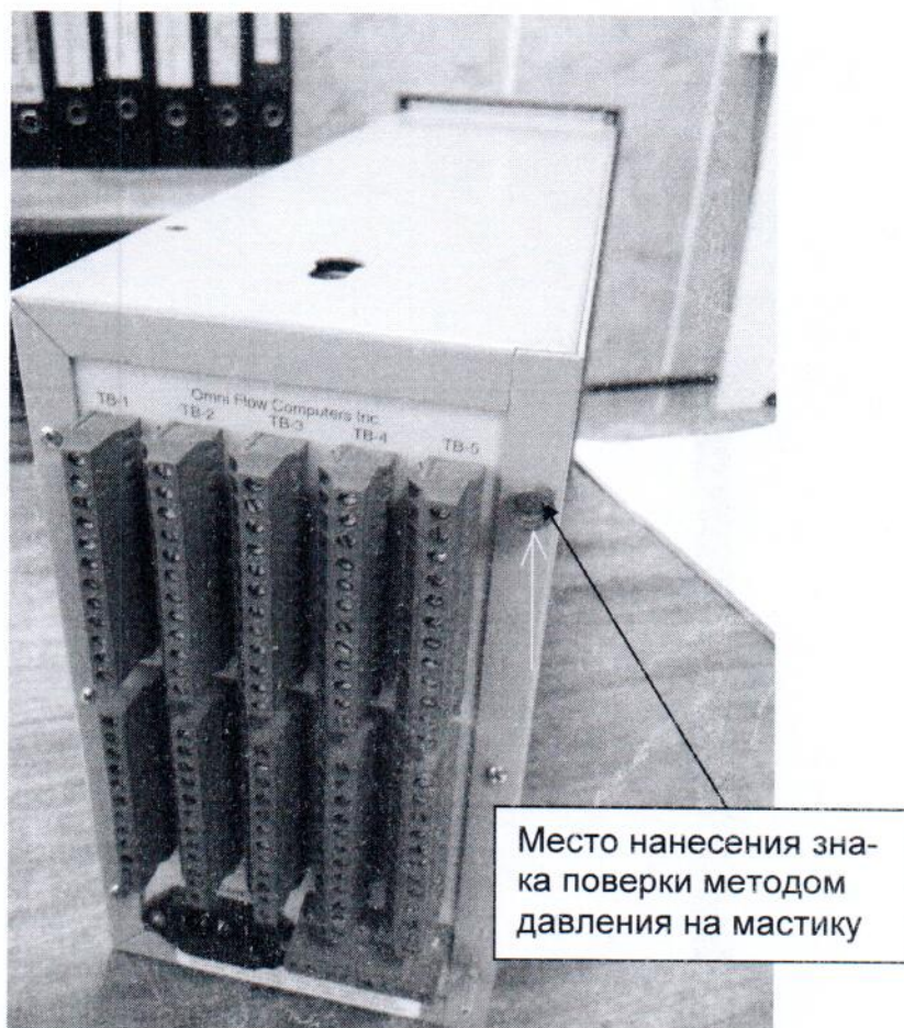
Рисунок 3.2 – Место пломбировки на задней поверхности