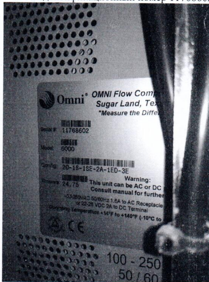
Рисунок 1.2 – Маркировка контроллера измерительно-вычислительного OMNI 6000 идентификационный номер 11768602