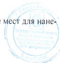
Схема пломбировки от несанкционированного доступа и обозначение мест для нанесения отпечатков клейм приведена на рисунке 2.