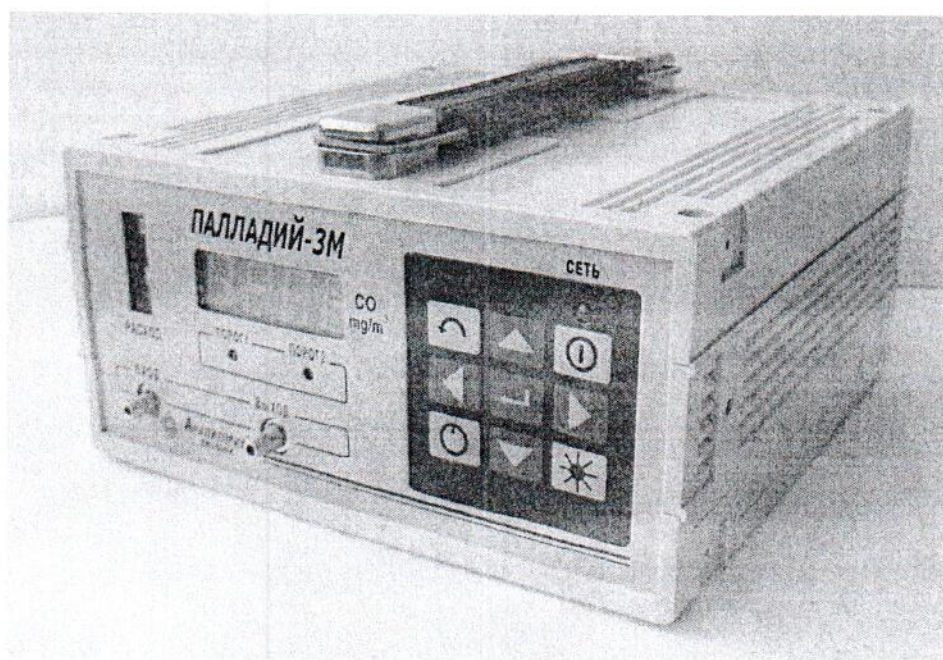
Рисунок 1 - Внешний вид газоанализаторов

Внешний вид газоанализаторов показан на рисунке 1.