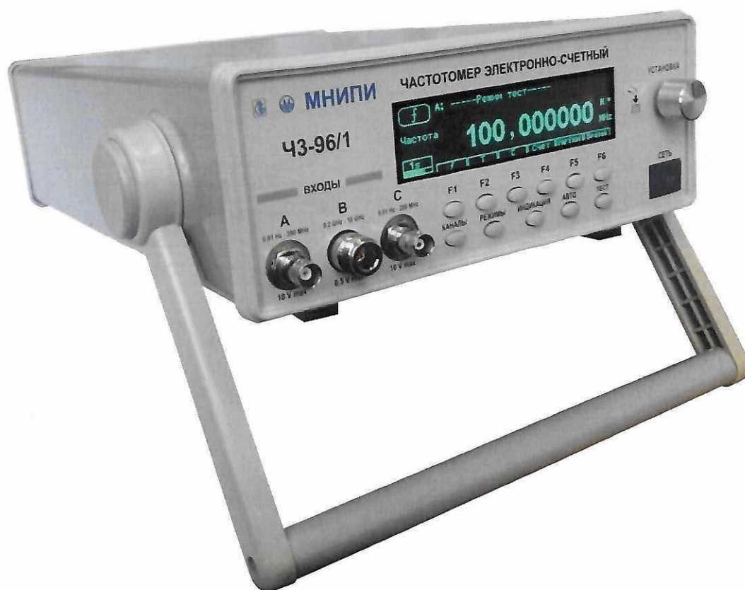
Рисунок 1.2 – Частотомер электронно-счетный ЧЗ-96/1. Внешний вид