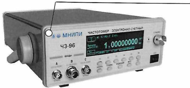
Рисунок 2.1 – Частотомер электронно-счетный ЧЗ-96. Место нанесения знака поверки (клейма-наклейки)