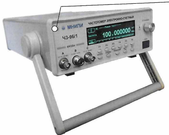
Рисунок 2.2 – Частотомер электронно-счетный ЧЗ-96/1. Место нанесения знака поверки (клейма-наклейки)