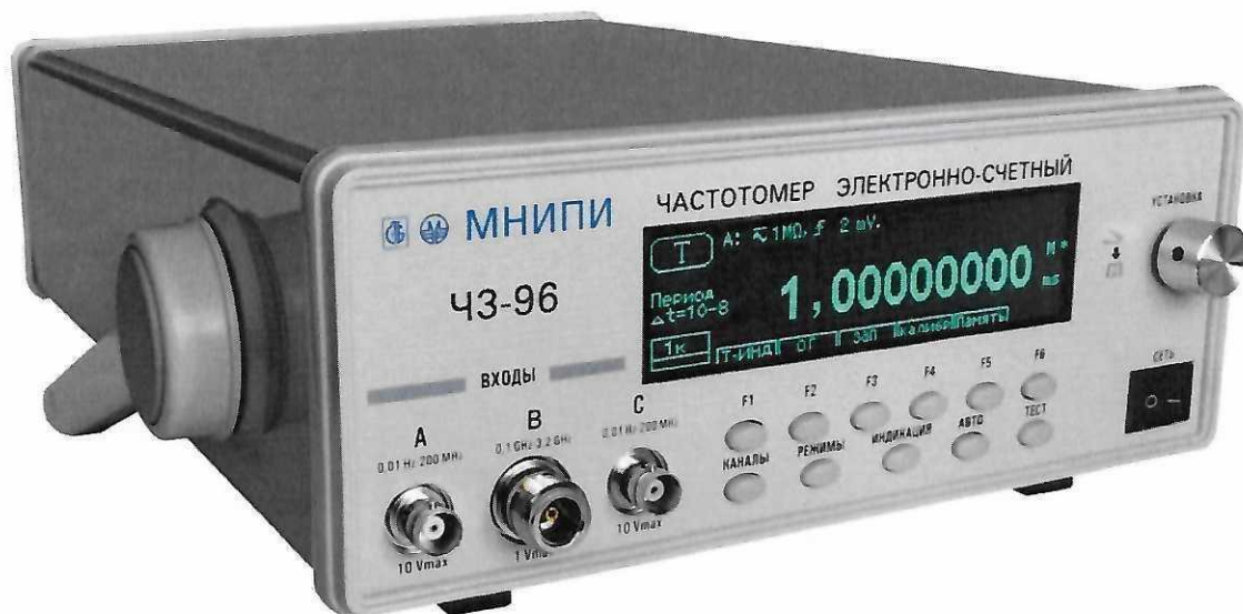
Рисунок 1.1 – Частотомер электронно-счетный ЧЗ-96. Внешний вид

Фотографии общего вида средства измерений