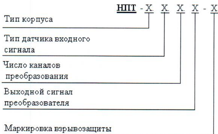
Рисунок 1 - Структура условного обозначения преобразователей

Информация о возможных исполнениях преобразователей приведена в структуре условного обозначения, представленного на рисунке 1.