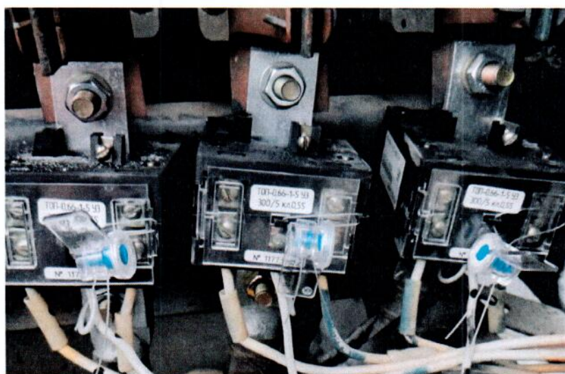
Рисунок 3 – Фотография компонентов АСКУЭ при применении трансформаторов тока ТОП-0,66