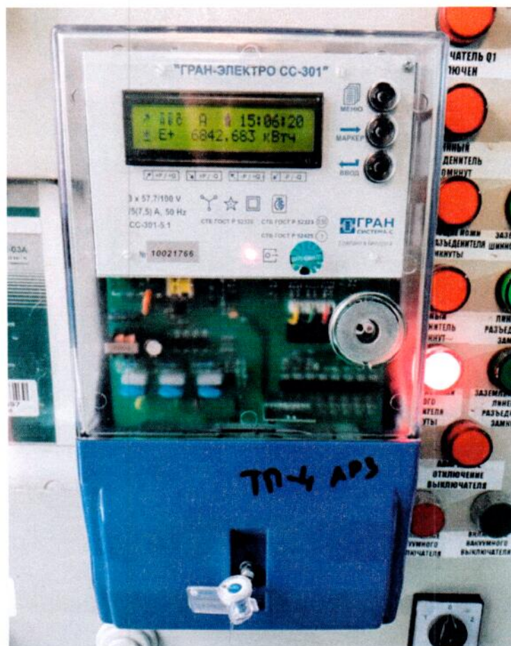
Рисунок 2 – Фотография компонентов измерительного канала АСКУЭ при применении счетчик электрической энергии «Гран-Электро СС-301»