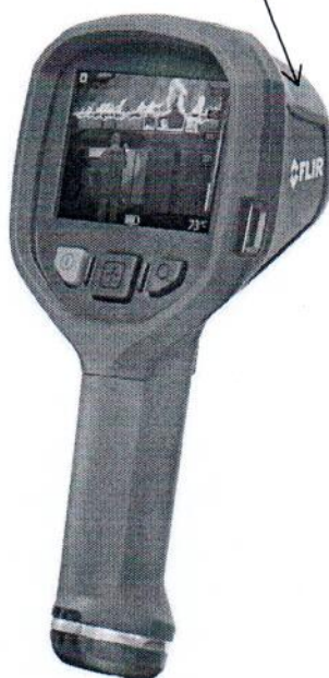
Рисунок 2.1 – Схема (рисунок) с указанием места для нанесения знака поверки средств измерений (изображение носит иллюстративный характер)