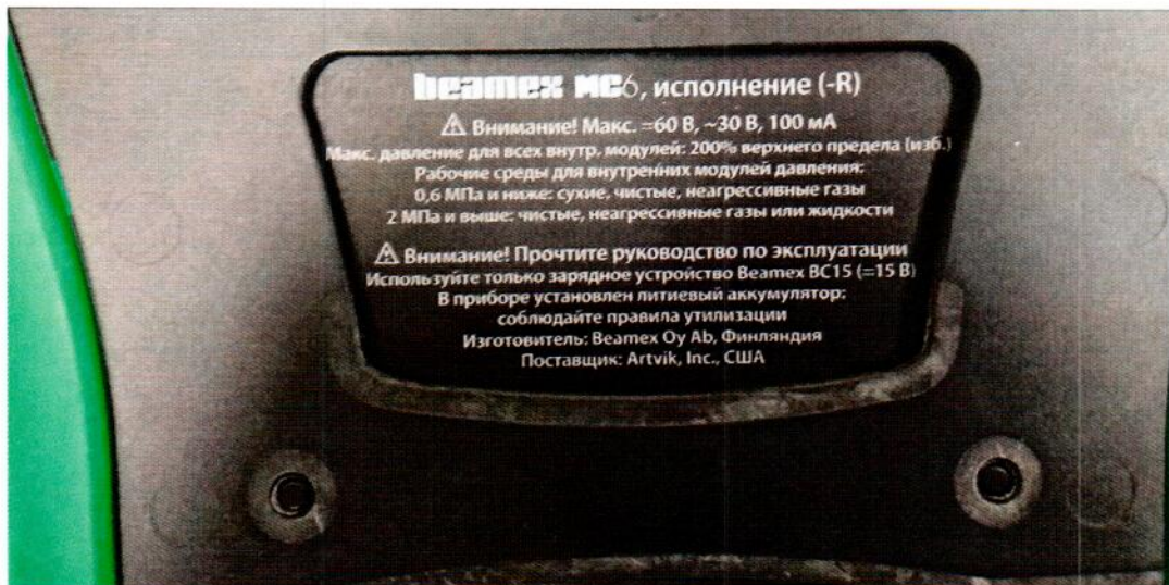
Рисунок 1.2 – Фотографии маркировки калибратора