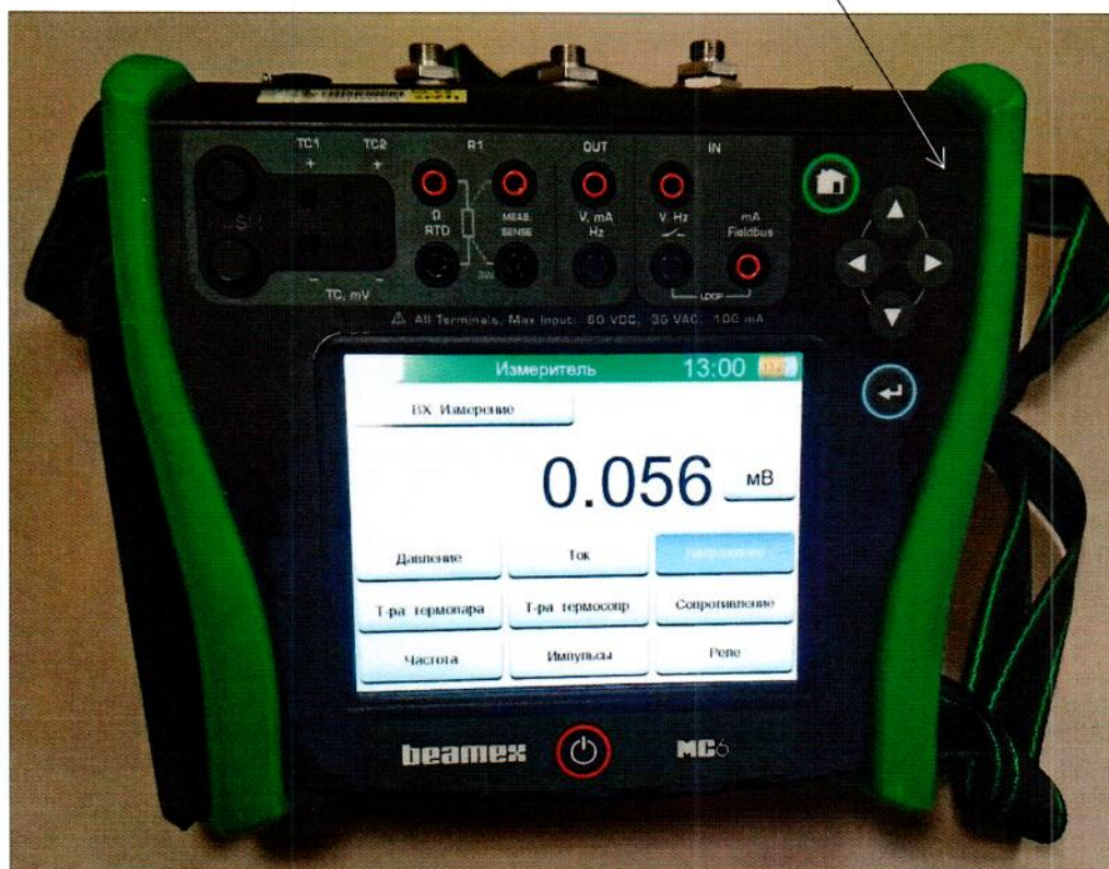
Рисунок 2.1 – Схема (рисунок) с указанием места для нанесения знака поверки средств измерений

Место для нанесения знака поверки средств измерений