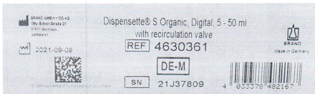
Рисунок 1.2 – Фотография маркировки дозатора бутылочного Dispensette S Organic № 21J37809