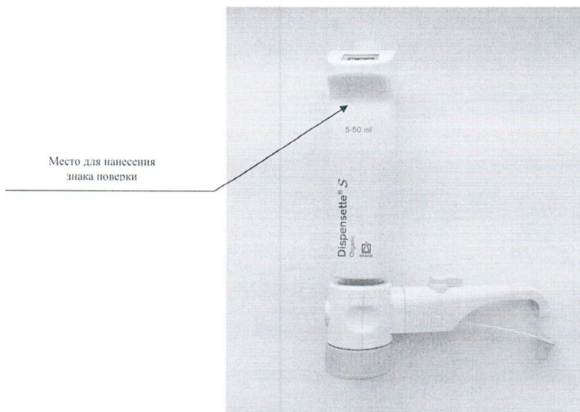
Рисунок 2.1 – Схема (рисунок) с указанием места для нанесения знака поверки

Схема (рисунок) с указанием места для нанесения знака поверки средств измерений