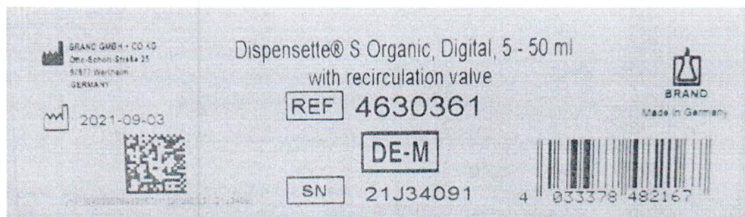
Рисунок 1.2 – Фотография маркировки дозатора бутылочного Dispensette S Organic № 21J34091