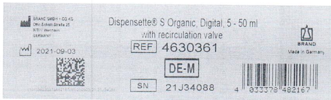
Рисунок 1.2 – Фотография маркировки дозатора бутылочного Dispensette S Organic № 21J34088