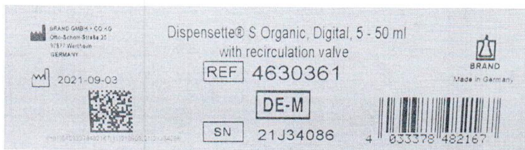
Рисунок 1.2 – Фотография маркировки дозатора бутылочного Dispensette S Organic № 21J34086