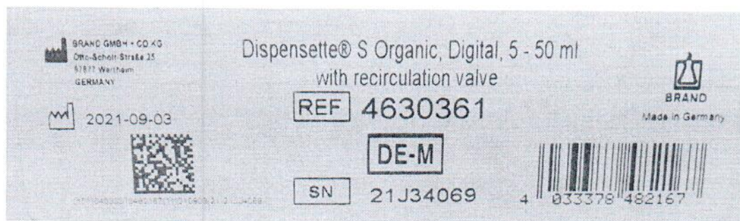
Рисунок 1.2 – Фотография маркировки дозатора бутылочного Dispensette S Organic № 21J34069