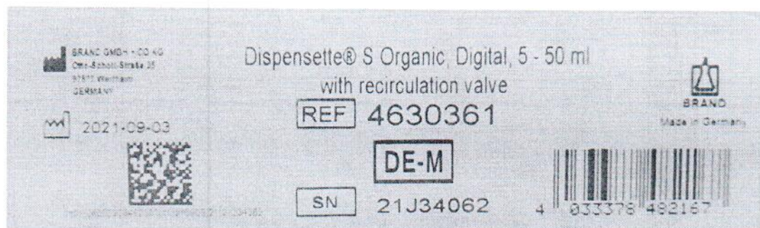
Рисунок 1.2 – Фотография маркировки дозатора бутылочного Dispensette S Organic № 21J34062