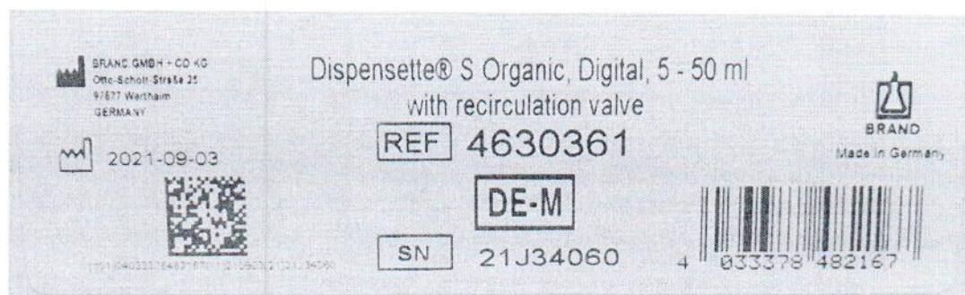
Рисунок 1.2 – Фотография маркировки дозатора бутылочного Dispensette S Organic № 21J34060