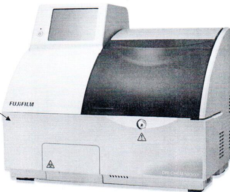
Рисунок 2.1 – Схема (рисунок) с указанием места для нанесения знака поверки