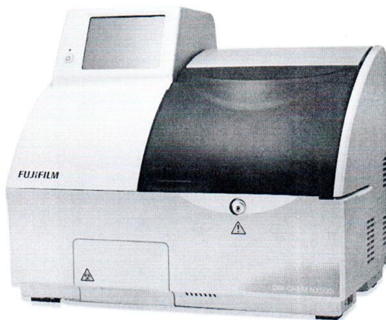
Рисунок 1.1 – Фотография общего вида анализатора биохимического автоматического с принадлежностями и материалами расходными: исполнение FUJI DRI-CHEM NX-500i № 16669064