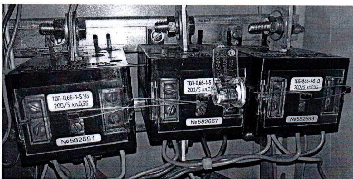
Рисунок 3 – Фотография компонентов АСКУЭ при применении трансформаторов тока Т0П-0,66