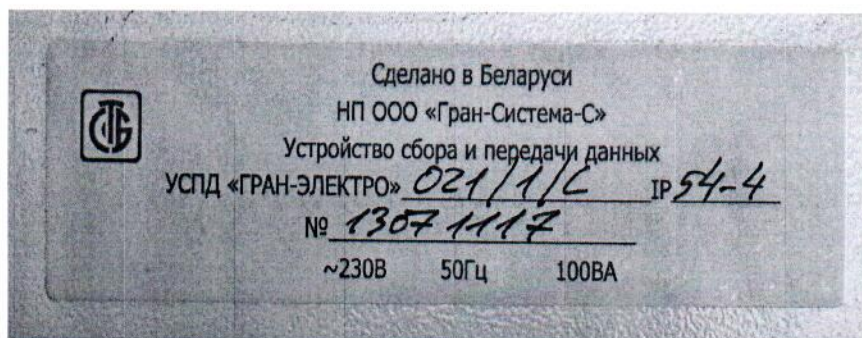
Рисунок 1 – Фотография компонентов АСКУЭ. УСПД «ГРАН-ЭЛЕКТРО»