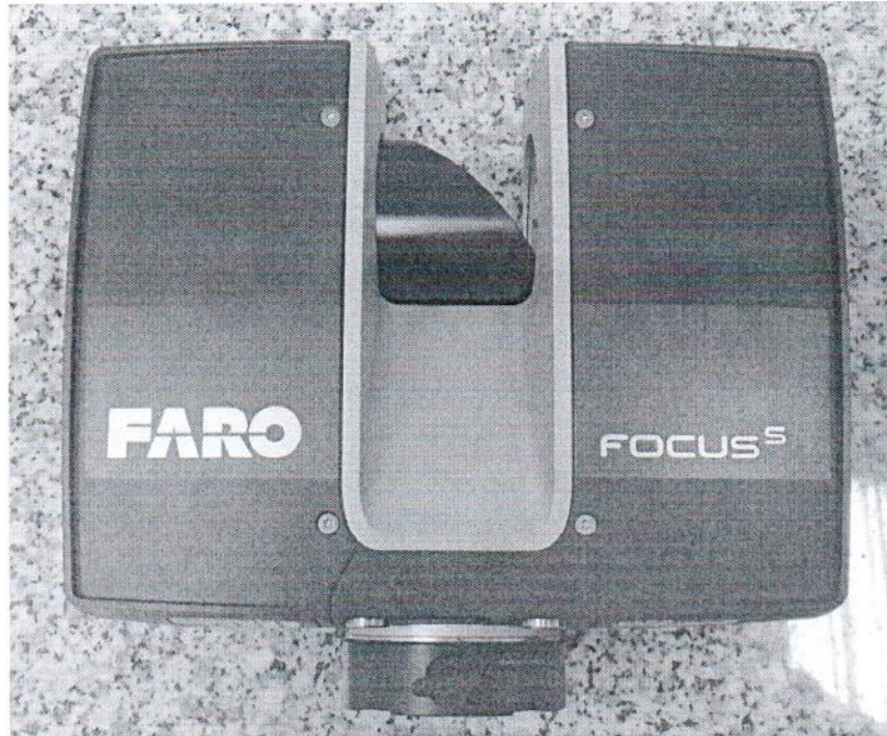
Рисунок 1.1 – Фотография общего вида лазерного сканера FARO Focus S70 № LLS081914642