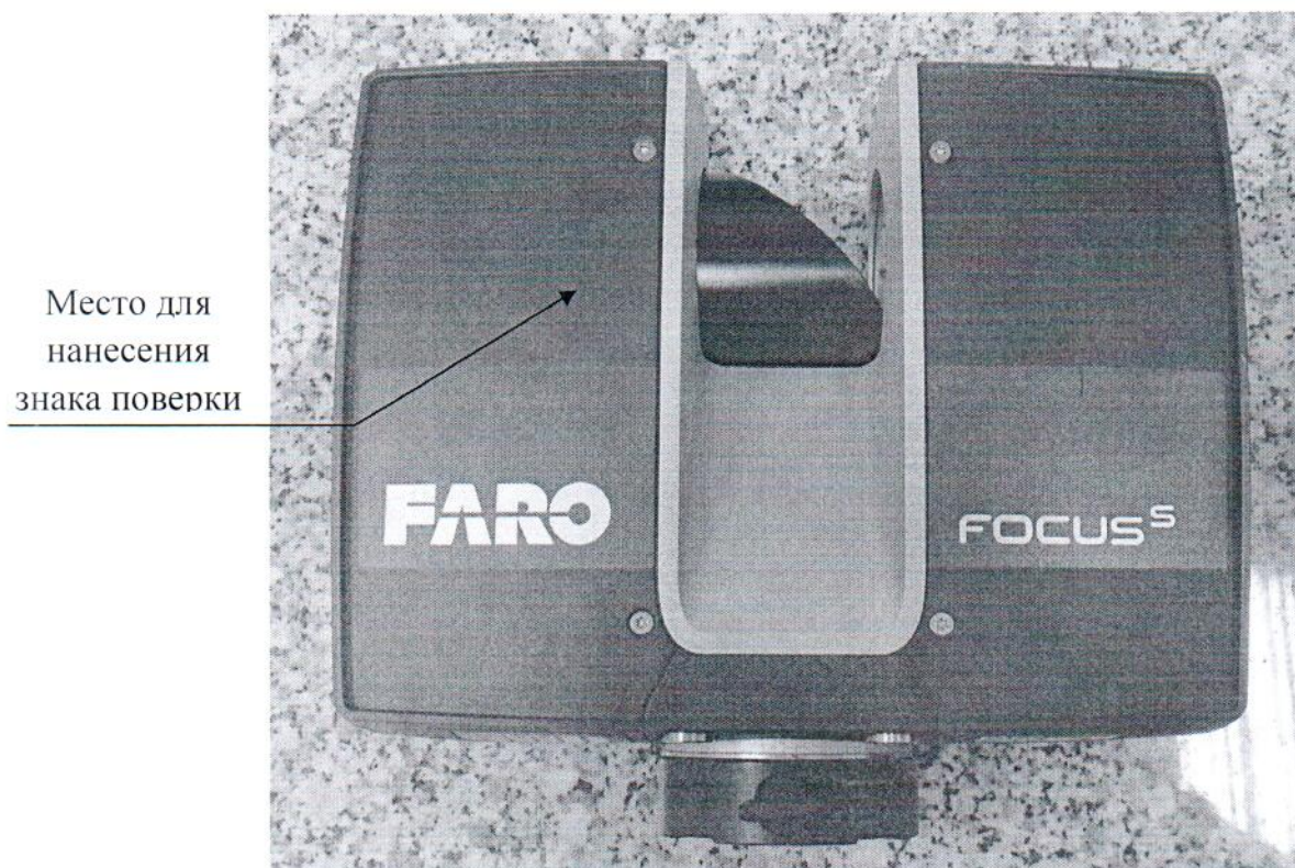
Рисунок 2.1 – Схема (рисунок) с указанием места для нанесения знака поверки средств измерений

Схема (рисунок) с указанием места для нанесения знака поверки средств измерений