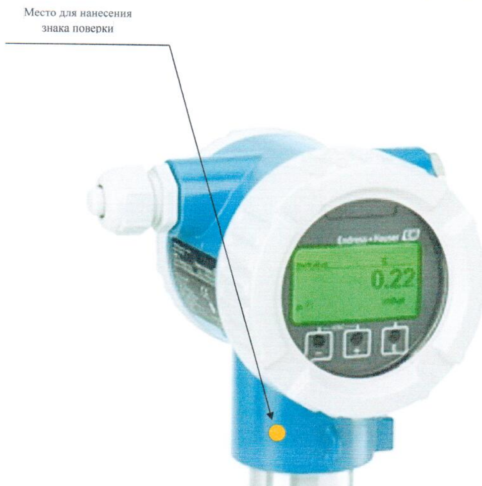
Рисунок 2.1 – Схема (рисунок) с указанием места для нанесения знака поверки

Схема (рисунок) с указанием места для нанесения знака поверки средств измерений