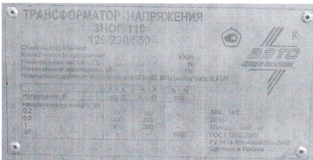
Рисунок 3 - Табличка технических данных