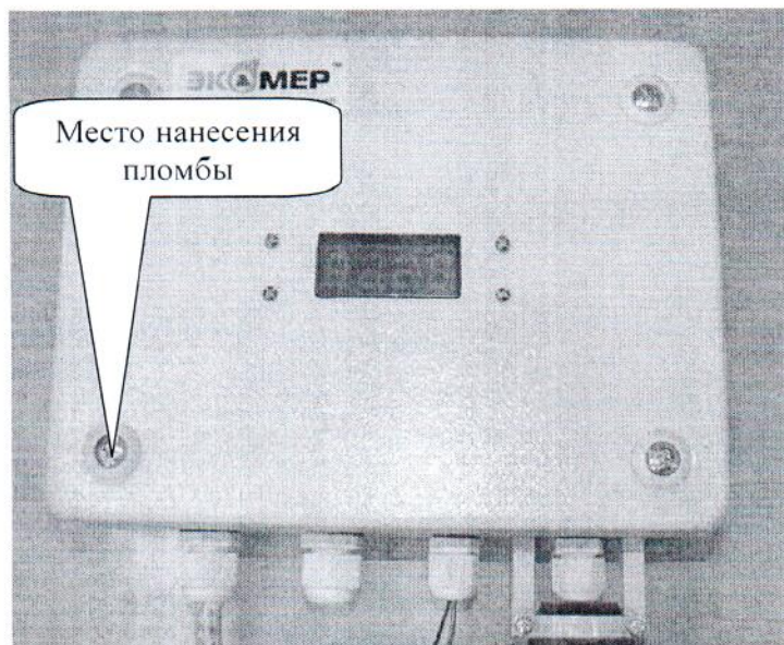
Рисунок 3 - Схема пломбирования газоанализатора ИКТС-11 исполнения ИКТС-11.М от несанкционированного доступа.