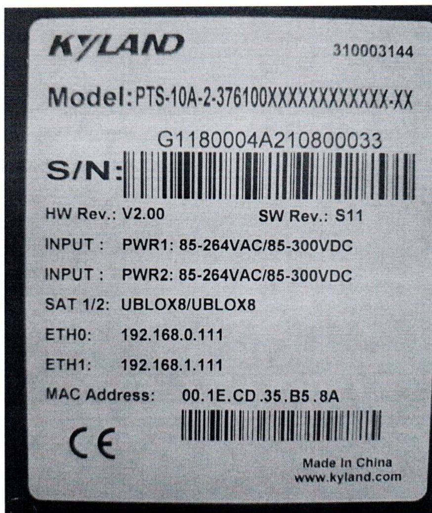
Рисунок 1.2 – Фотография маркировки сервера точного времени PTS-10A-2-376100XXXXXXXXXXXX-XX № G1180004A210800033