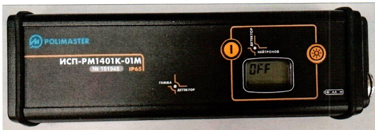
Рисунок 1.1 – Фотография общего вида приборов