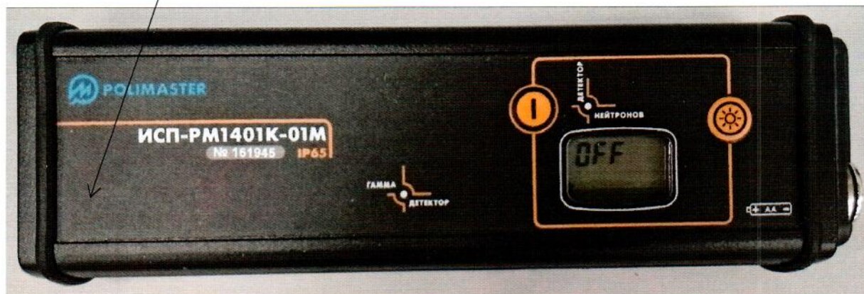
Рисунок 2.1 – Схема (рисунок) с указанием места для нанесения знака поверки