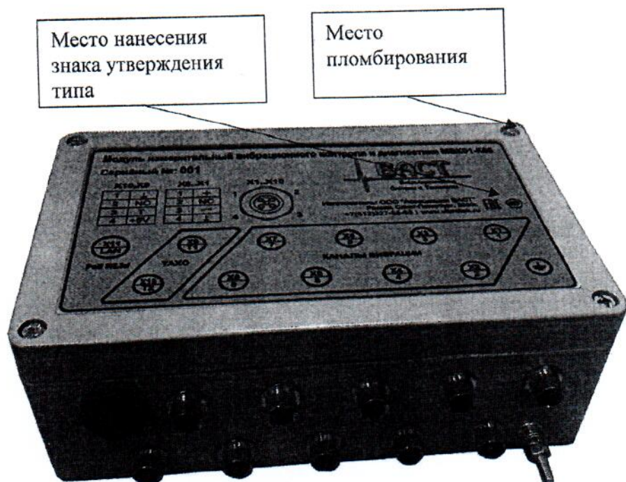
Рисунок 3 - Общий вид, место нанесения знака утверждения типа и место пломбирования от несанкционированного доступа модулей измерительных вибрационного контроля и диагностики MBK01-K65