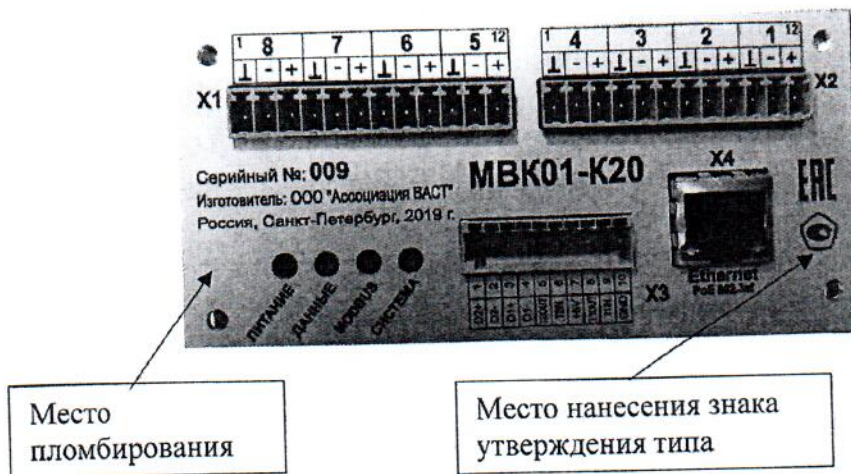
Рисунок 1 - Общий вид, место нанесения знака утверждения типа и место пломбирования от несанкционированного доступа модулей измерительных вибрационного контроля и диагностики MBK01-K20