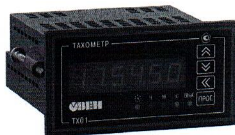
Рисунок 3 - Общий вид счетчиков в корпусе для щитового (Щ2) крепления

Пломбирование счетчиков не предусмотрено.