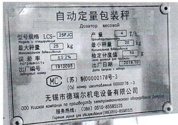
Рисунок 1.2 – Маркировка дозатора весового автоматического LCS-25FJC № 1910095