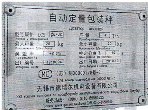
Рисунок 1.2 – Маркировка дозатора весового автоматического LCS-25FJC № 1910094