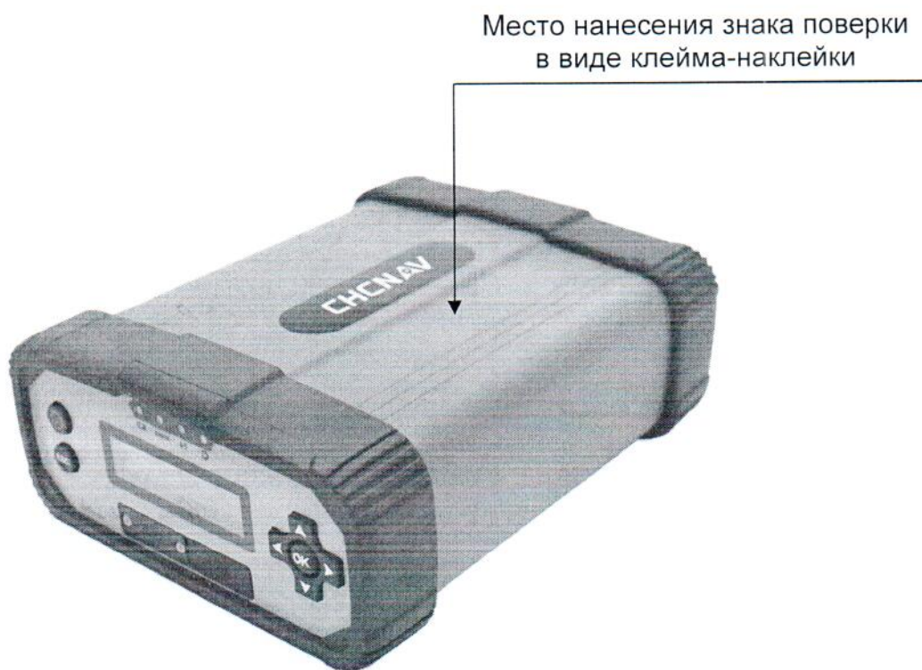
Рисунок А.1 – Место нанесения знака поверки в виде клейма-наклейки

Место нанесения знака поверки в виде клейма-наклейки