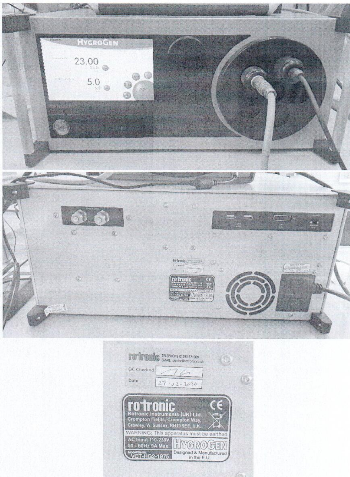
Рисунок 1.1 – Внешний вид и маркировка генератора влажного газа HygroGen2-S № VCT-HG2-1975