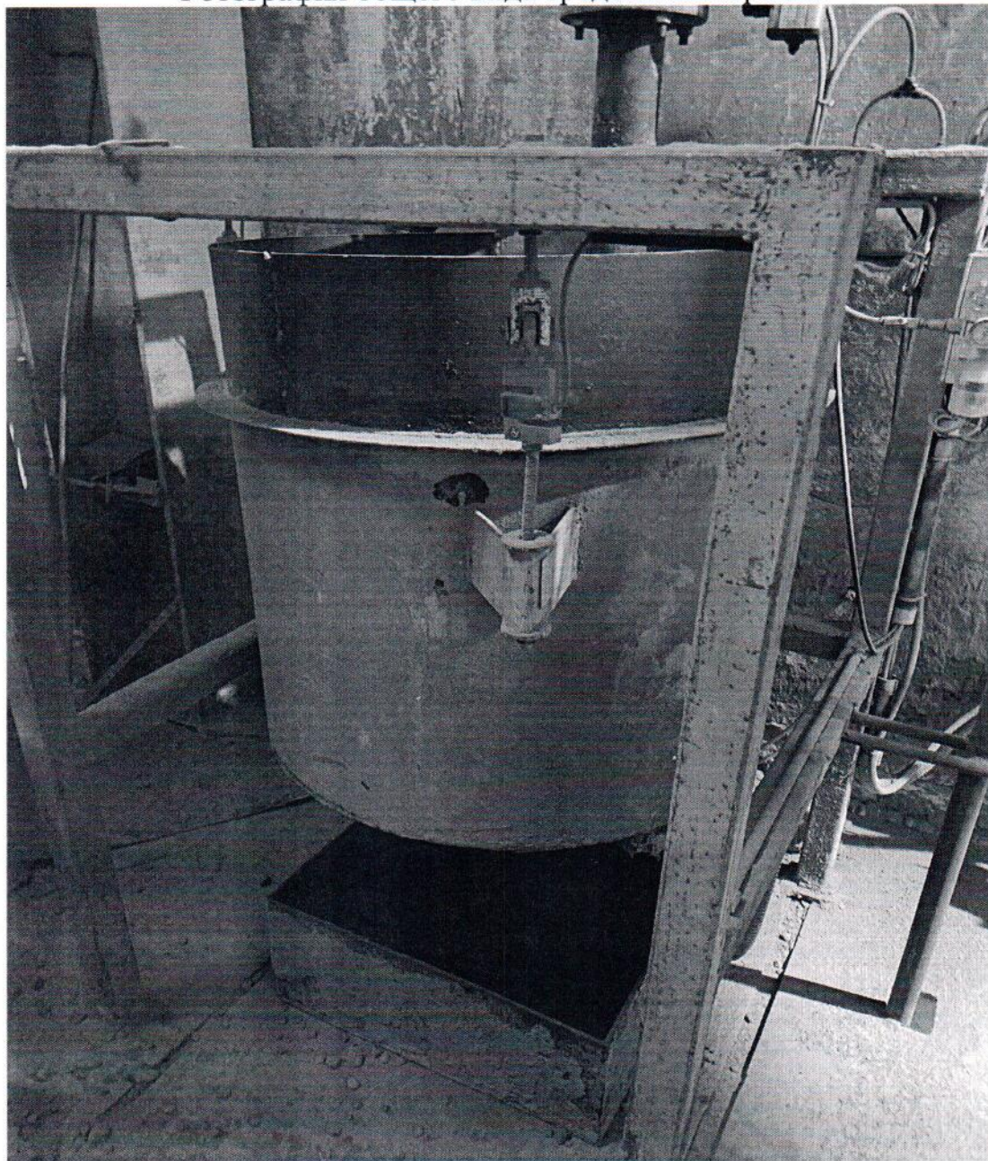
Рисунок 1.1 – Внешний вид дозатора весового дискретного действия воды ДВДВ-500 №11702658_8

Фотография общего вида средства измерения