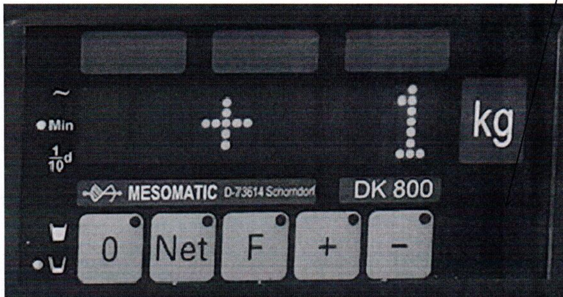
Рисунок 2.1 - Фотография с указанием места нанесения знака поверки (наклейки) на лицевую панель преобразователя весоизмерительного Mesomatic DK800.

Место нанесения знака поверки (наклейки)