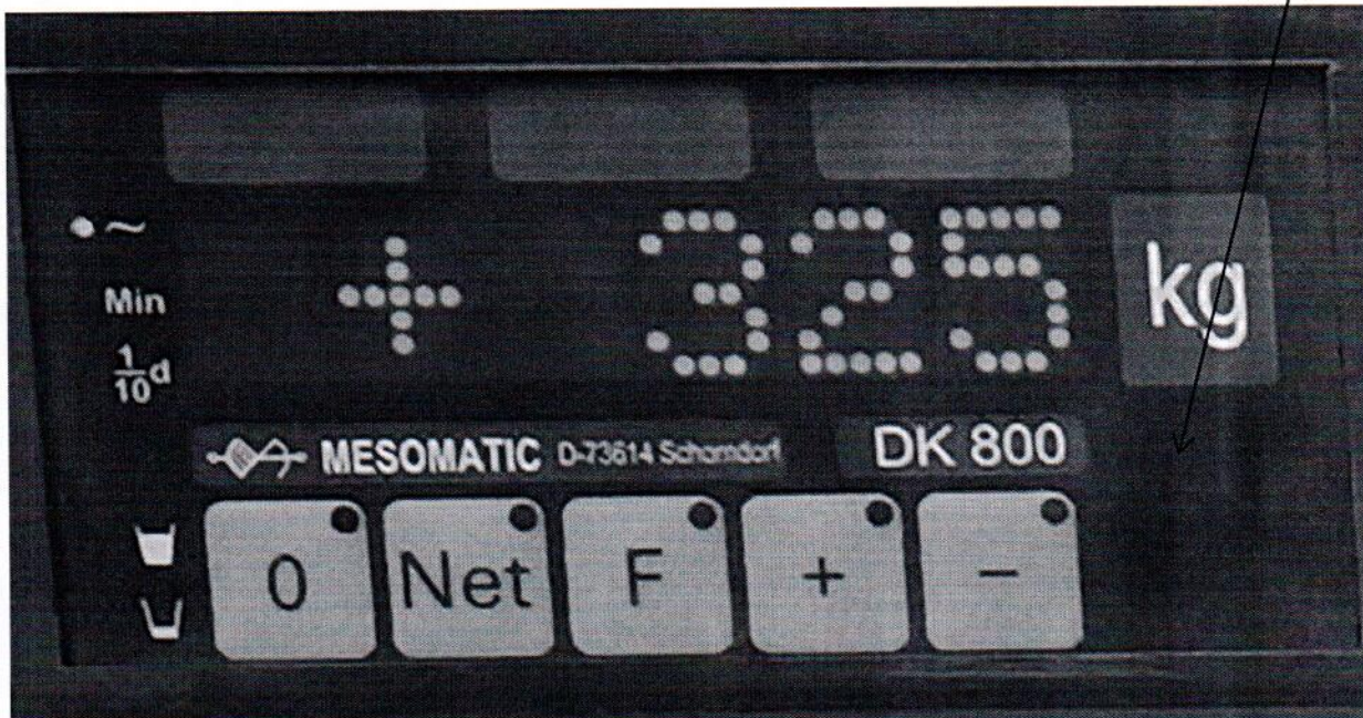
Рисунок 2.1 - Фотография с указанием места нанесения знака поверки (наклейки) на лицевую панель преобразователя весоизмерительного Mesomatic DK800.

Место нанесения знака поверки (наклейки)