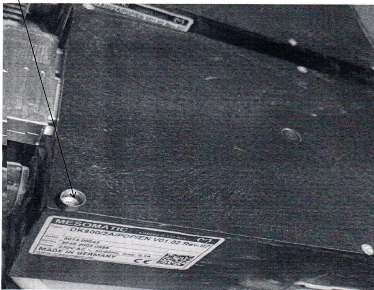
Рисунок 2.3 - Фотография с указанием места нанесения знака поверки давлением на специальную мастику на корпусе преобразователя весоизмерительного Mesomatic DK800.

Место нанесения знака поверки давлением на специальную мастику