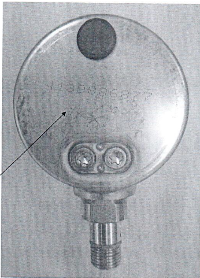
Рисунок 2 – Схема с указанием места нанесения знака поверки