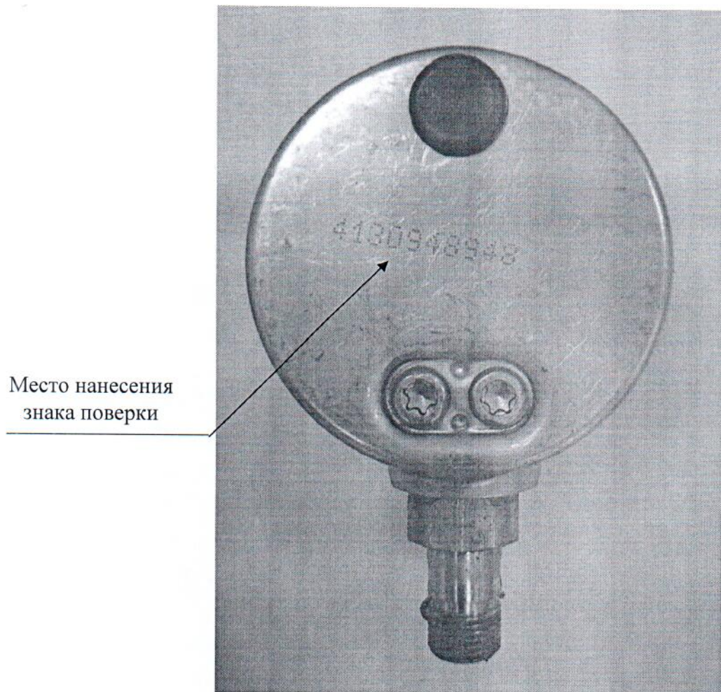
Рисунок 2 – Схема с указанием места нанесения знака поверки

Схема (рисунок) с указанием места нанесения знака поверки средств измерений