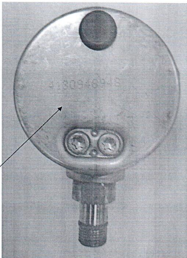
Рисунок 2 – Схема с указанием места нанесения знака поверки