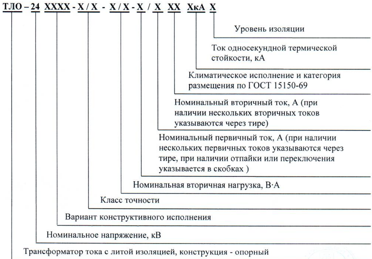
Рисунок 4 – Расшифровка условного обозначения трансформаторов