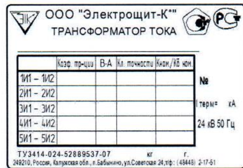
Рисунок 3 – Место нанесения паспортной таблички и знака утверждения типа