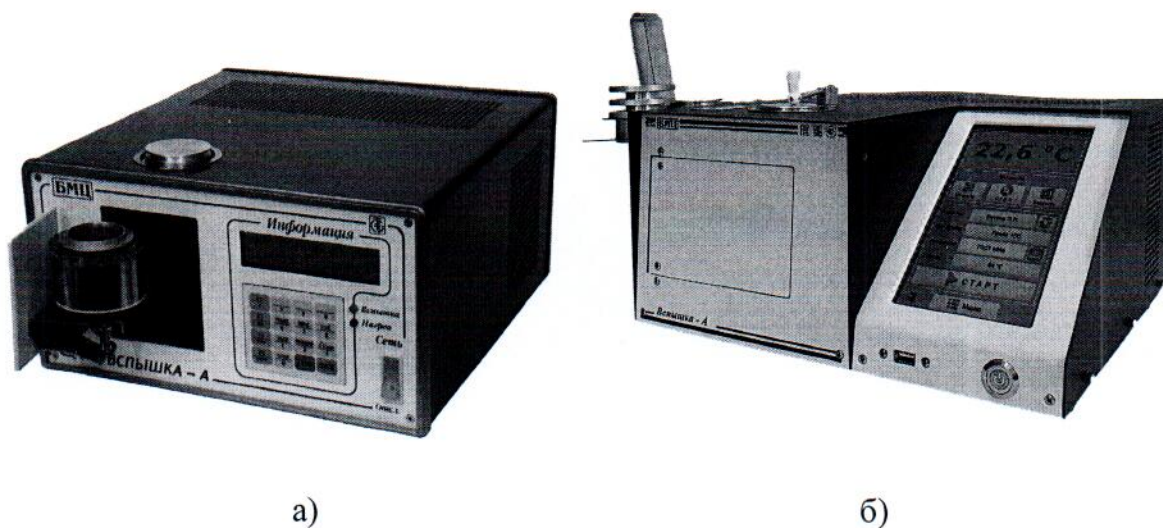
Рисунок 1. Внешний вид регистраторов автоматических температуры вспышки нефтепродуктов «Вспышка-А»: а - исполнение 1; б - исполнение 2.