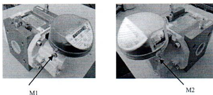
Рисунок 2 - Схема пломбировки от несанкционированного доступа, обозначение места нанесения знака поверки (M1, M2)