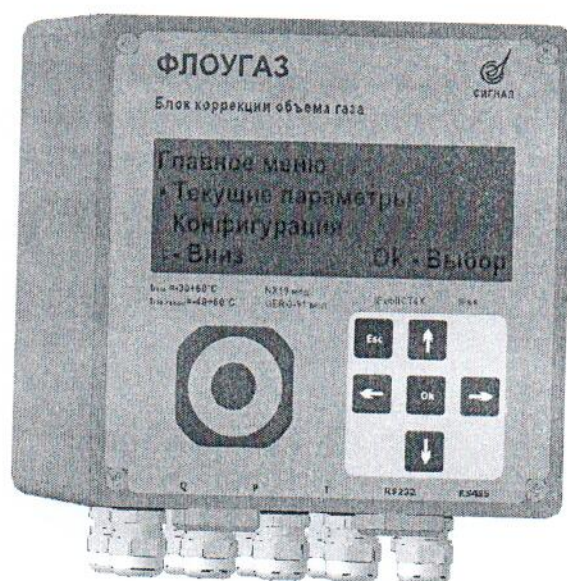
Рисунок 1 – Общий вид блока коррекции объема газа «ФЛОУГАЗ»

вычислитель микропроцессорный, состав которого входят корпус, микропроцессор, модуль связи, оптопорт, дисплей, клавиатура, автономный источник питания; интегрированный преобразователь абсолютного (избыточного) давления; интегрированный преобразователь перепада давления; интегрированный преобразователь температуры газа; интегрированный преобразователь температуры окружающей среды; комплект монтажных частей для установки блока на счетчик газа.