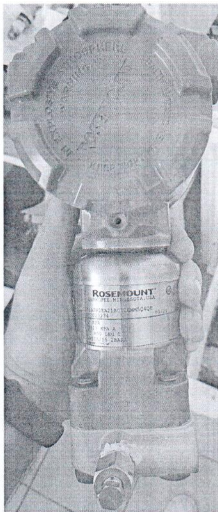
Рисунок 1.1 – Внешний вид преобразователя многопараметрического зав. № 21SHFF0020274