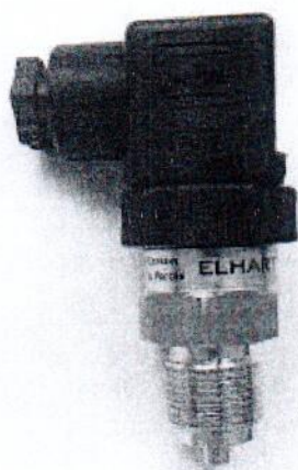
Рисунок 1 – Общий вид датчика

Пломбирование датчиков не предусмотрено.