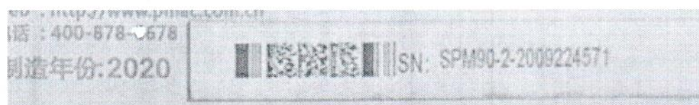
Рисунок 1.2 – Маркировка счетчика SPM90 зав. № SPM90-2-2009224571