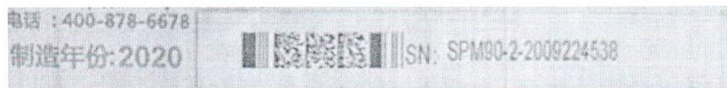
Рисунок 1.2 – Маркировка счетчика SPM90 зав. № SPM90-2-2009224538