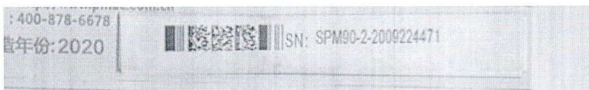
Рисунок 1.2 – Маркировка счетчика SPM90 зав. № SPM90-2-2009224471