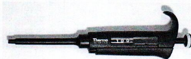
Рисунок 2 – Общий вид одноканальных дозаторов

Пломбирование дозаторов не предусмотрено.