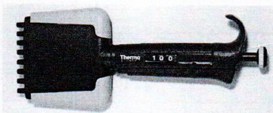
Рисунок 1 – Общий вид многоканальных дозаторов

Выпускается тридцать пять модификаций дозаторов: пятнадцать одноканальных с фиксированным объемом доз (ДПОФ), десять одноканальных с переменным объемом доз (ДПОП) и десять многоканальных с переменным объемом доз (ДПМП).