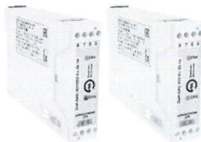
Рисунок 2 — Внешний вид барьеров серии ЭНИ-БИС-3хх-Ех

Барьеры могут применяться в различных отраслях промышленности в системах автоматического контроля, регулирования и управления технологическими процессами, связанными с получением, переработкой, использованием и хранением взрывоопасных и пожароопасных веществ.