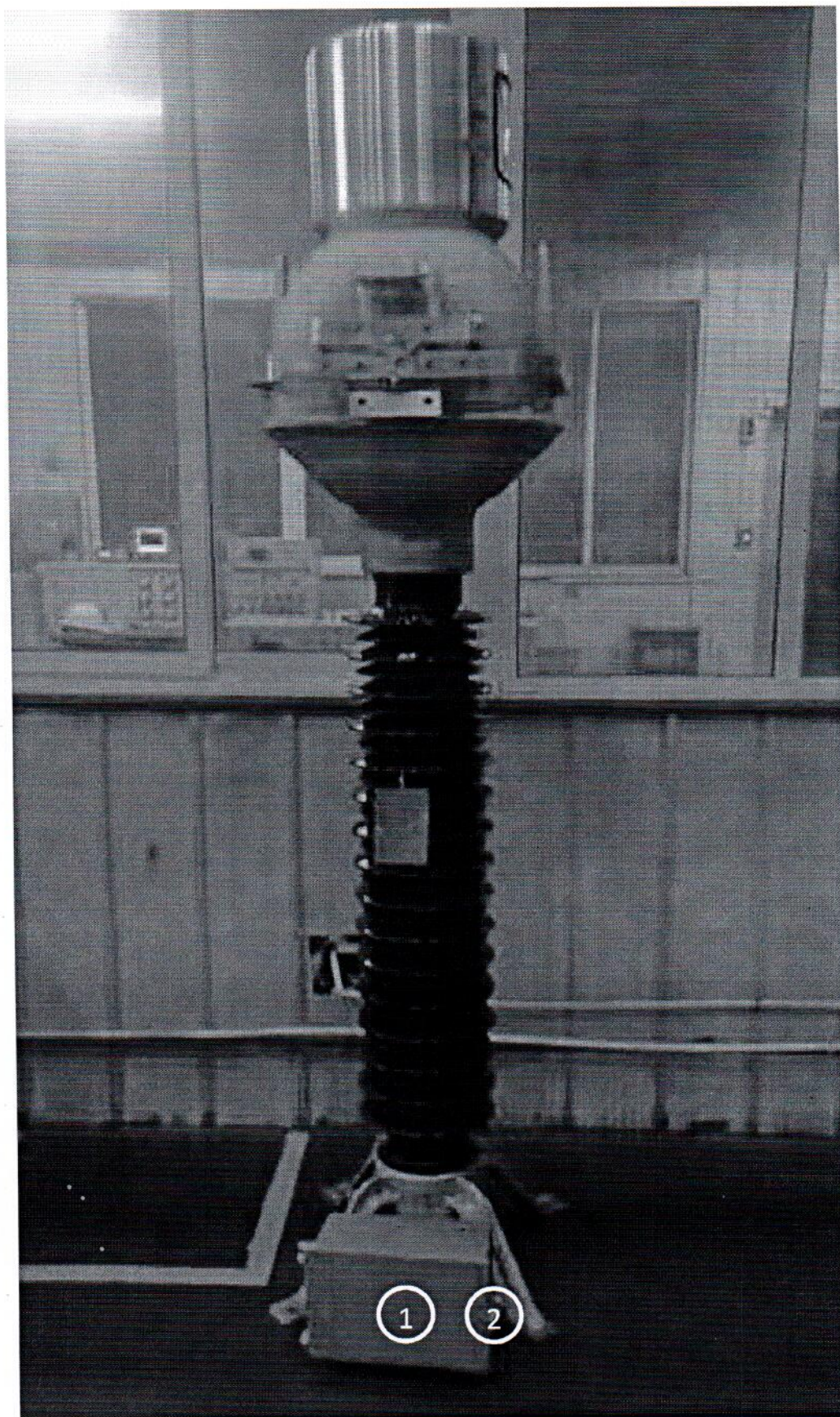
Рисунок 1 - Фотография общего вида со схемой нанесения знака поверки и места пломбировки 1 - место нанесения знака поверки, 2 - место пломбировки от несанкционированного доступа