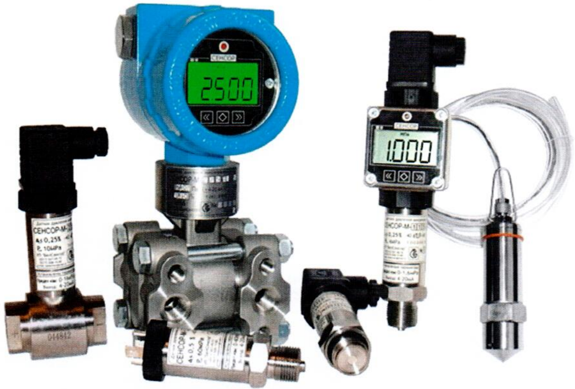
Рисунок 1.1 – Общий вид датчиков

Фотографии общего вида средств измерений