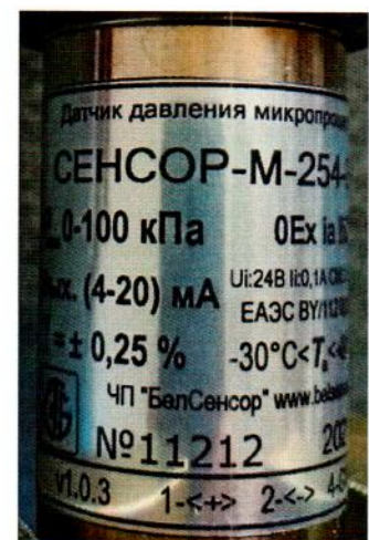
Рисунок 1.2 – Маркировка датчиков